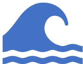
SARA VISCONTI "A Scuola di Sport - Lombardia in gioco"